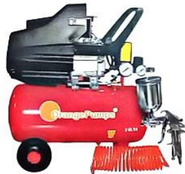
CLAVE (0908) SGBM24L (Sin pistola y manguera)

USA ACEITE MONOGRADO SAE30/ISO100 250 ML