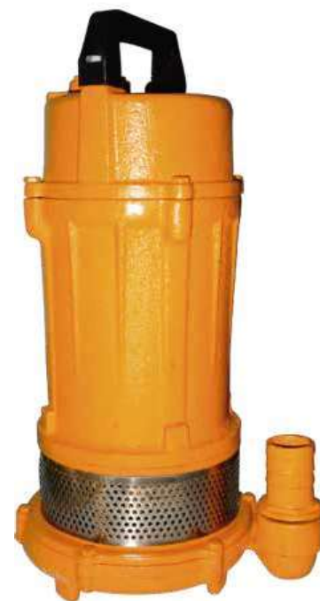
Modelo: QDX-18-500 / QDX-26-750